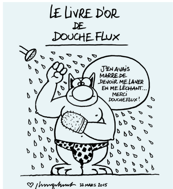
Dessin de Geluck et autres témoignages dans le livre d'or de DoucheFLUX à l'occasion du DoucheFLUX Sunday, premier « fundraising » festif de l'association qui a eu lieu le 22 mars dans les futurs bâtiments à Anderlecht.