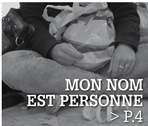
MON NOM EST PERSONNE > P.4