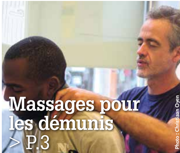
Massages pour les démunis > P.3

« Oui, souvent, je les expulse », a répondu Donald Trump, un candidat républicain et trublion extrême droitiste américain.