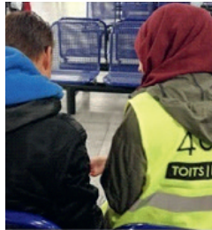
400T 2 e enquête