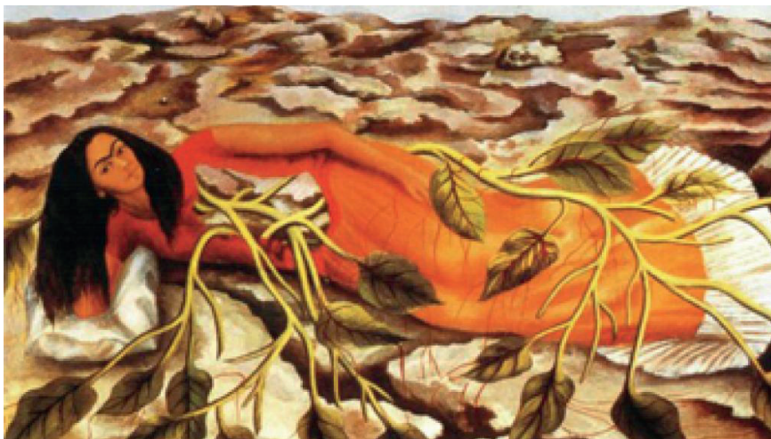
Frida Kahlo & Diego Rivera, « L'art en fusion »

est une artiste peintre mexicaine, née le 6 juillet 1907 et morte le 13 juillet 1954.