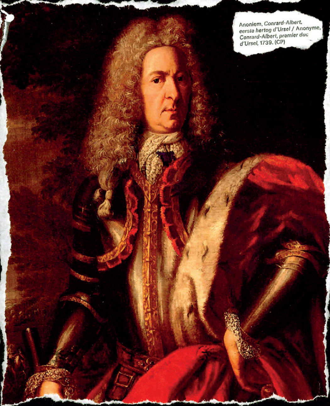
Anoniem, Conrad-Albert, eerste hertog d'Ursel / Anonyme, Conrad-Albert, premier duc d'Ursel, 1739. (CP)